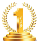
취업률 84.1% 대구·경북 1위, 전국 4위 2018년 1월 정보공시